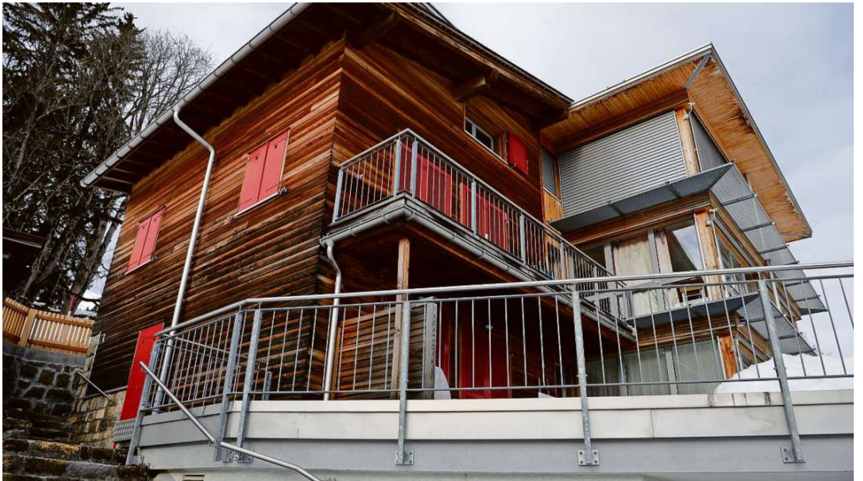
Heute privat: Das Flueblüemli in Braunwald ist umgebaut worden und dient heute als Ferienhaus.

Es gibt einen Hinweis darauf, dass der Bericht an ihn versandt wurde: Die Pflegeeltern haben in ihren Akten die Kopie eines Briefs an die Vormundschaftsbehörde abgelegt. Laut diesem Brief – genannt ist in der Adresse auch der Name des Präsidenten und Vormundes – haben die Pflegeeltern dem Vormund den Bericht geschickt. Ob der Brief allerdings wirklich versandt wur-