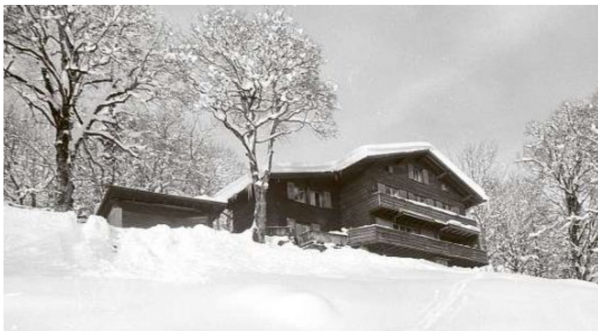
Lea wird als Kind im Heim Flueblüemli missbraucht: Obwohl es Hinweise auf den Übergriff gibt, bekommt sie keine Hilfe.