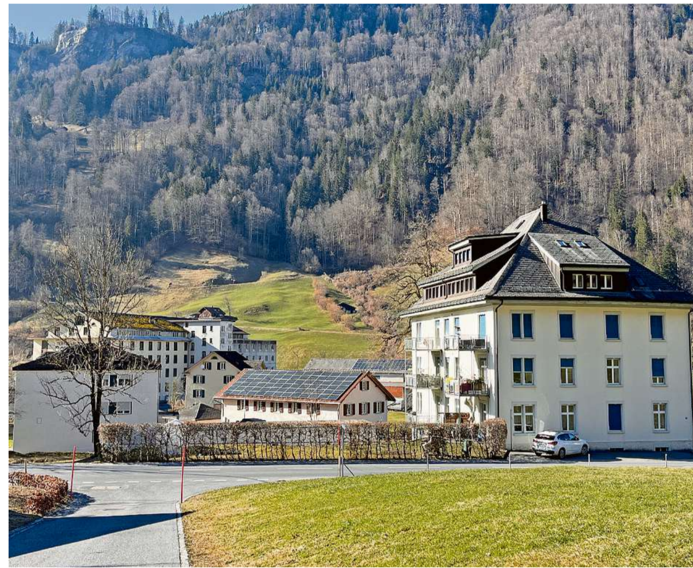
Das ehemalige Marienheim steht jetzt noch an der Dorfstrasse, wurde aber mittlerweile umgenutzt.