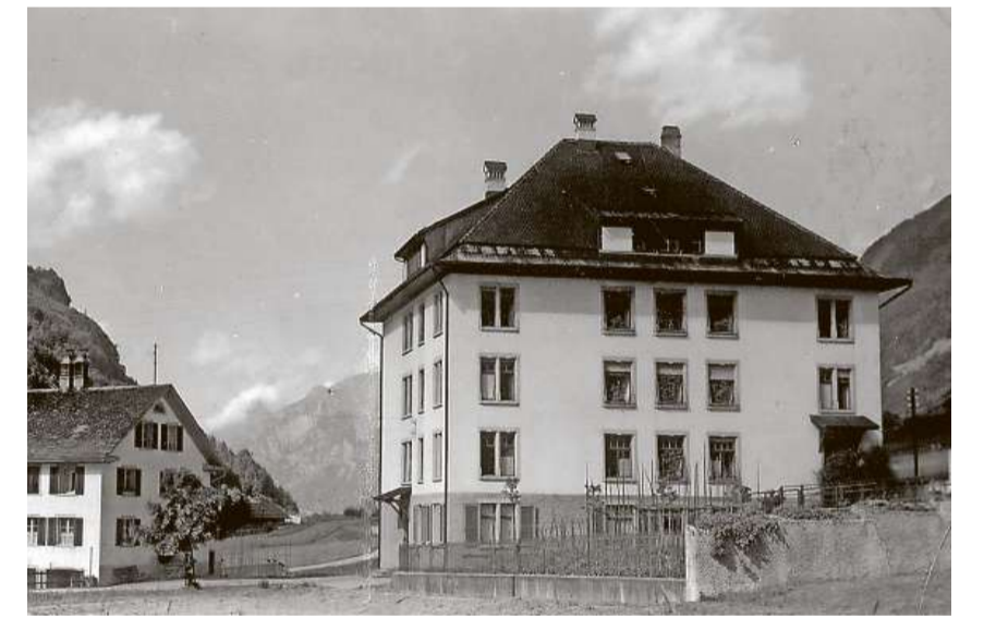
Das Marienheim in Rütli wurde in den Jahren 1909 und 1910 erbaut.