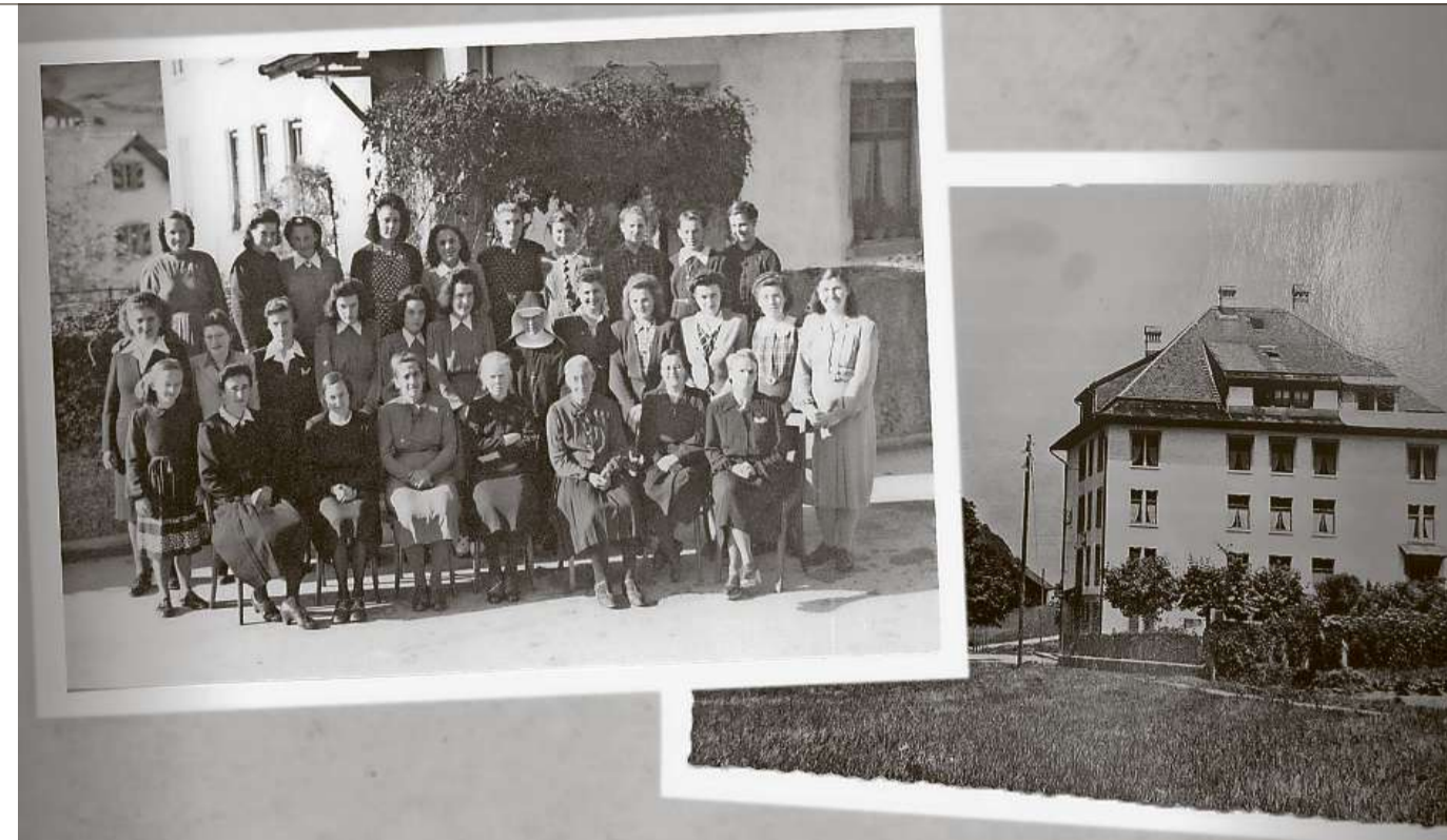
Gesuchte Arbeitskräfte für den Boom nach dem Zweiten Weltkrieg: In der Spinnererei in Rütli waren auch Zwangsarbeiterinnen beschäftigt. Gewohnt haben sie im sogenannten Marienheim, das der Fabrik angegliedert war.

Unbeachteter Skandal – alle schauten weg Obwohl viele von der Zwangsarbeit wussten, blieb der Aufschrei aus. «Fast alle schauten weg. Polizei, Ordens-