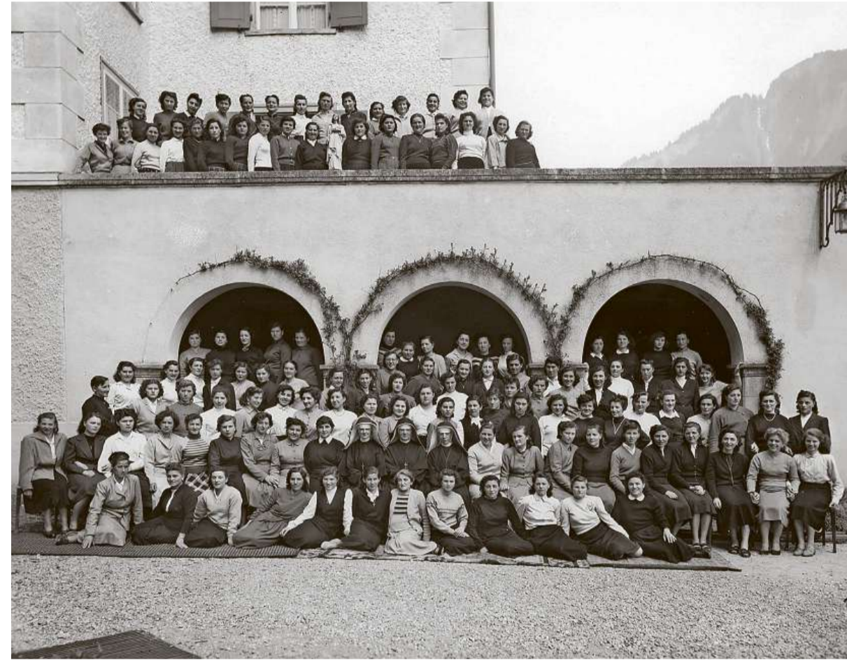
Die Bewohnerinnen des Marienheims im Jahr 1954.

Unter den wachsamen Augen der Schwestern Das sogenannte Marienheim stand unter der Aufsicht der Ingenbohler Ordenschwestern. Gemäss Demuths Recherchen waren in den ersten Jahren nach 1941 noch etliche Frauen unter Anordnung der Eltern «freiwillig» im Heim. Danach seien jedoch mehr «Versorgte» nach Rütli geschickt worden, obwohl Zwangsarbeit 1941 in der Schweiz untersagt wurde. Es brauchte wenig, dass die jungen Frauen in den Fokus der Fürsorgebehörden rückten. Zum Beispiel, wenn die Eltern arm oder geschieden waren. Wenn man als «arbeitschue» oder «unsittlich» eingestuft wurde. Oder wenn man eine «Uneheliche» war. Aus Sicht der Behörden war die Arbeit in den Fabriken eine therapeutische Massnahme. Die Betroffenen wurden nicht gerichtlich verurteilt. Vor Gericht konnten sie sich nicht gegen die Zwangsarbeit wehren.