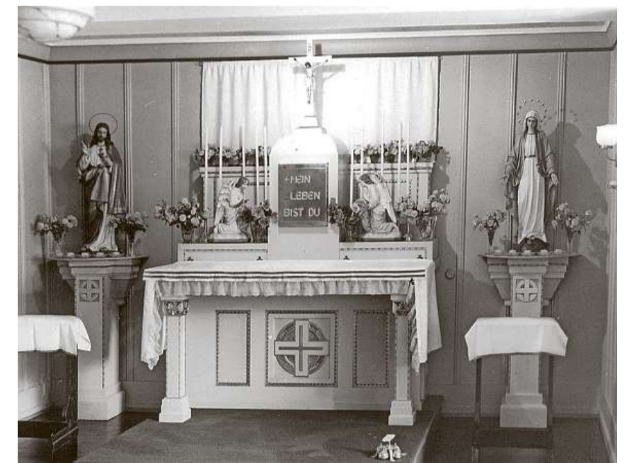
Der Altar im Marienheim in Rütli: Das ist eines der wenigen Fotos, die das Landesarchiv Glarus vom Heim hat. Es wurde 1951 aufgenommen.